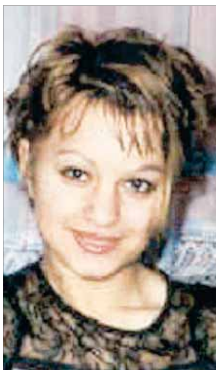
P. K. / B. / A.